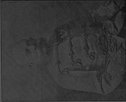
FRANCIS JOSEPH, Emperor of Austria.

ஆர்ச்சீயூக் ப்ராஸ்லிஸ் பெரிடிவான்ட், காஸாகூசென்ற ஆஸ்டிரியாவின் இளவரசர்; அவர் குடும்பம்.