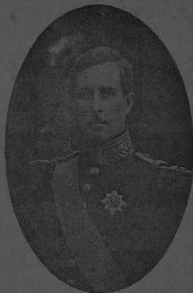
KING ALBERT OF BELGIUM.