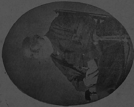
THE LATE SIR T. PALIT. காலஞ்சென்ற ஸர் தாரகநாத் ப்லிட்.

SUPPLEMENT TO "THE PEOPLE'S FRIEND." "ஜனநாயகம்" க்கு அனுப்புக.