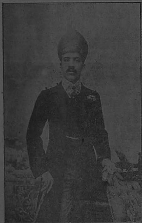
H. H. THE NIZAM OF HYDERABAD.