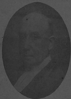
SIR JOHN WALLIS.

14-DAYLAK. 13-11-1900. 13-11-1900. 13-11-1900.