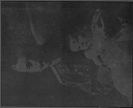
THE TSAR OF RUSSIA AND HIS HEIR. ரஷ்ய சகீரவர் தந்தையும் அவருடைய இளவரசரும்.