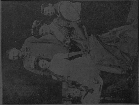
THE LATE ARCHDUKE FRANCIS FERDINAND Crown Prince of Austria, and his family.

SUPPLEMENT TO "THE PEOPLE'S FRIEND," "ஜனமாமாள்" க்கு அனுப்பும்.